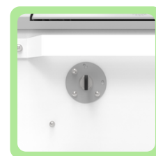
Chave de Segurança