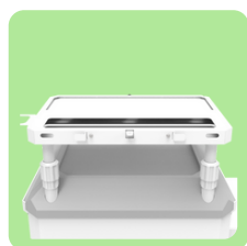
Trava de Notebook